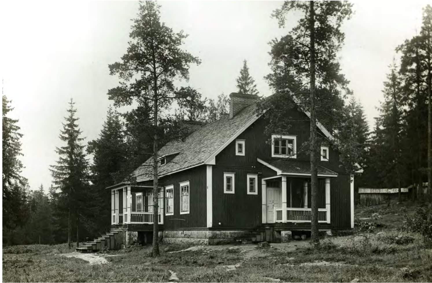
Kuvat ja kartat Tiina Valpolan arkisto

Fagerkullan työväen asuntoalueen 1920-luvun korttelit ja talot toteutettiin asiantuntijatoimiston tyyppiirustusten mukaan. Viisi ensimmäistä valmistuivat vuoden 1920 aikana. Kuvan talo ja sen takainen talo rakennettiin Högforsin johtokunnan pöytäkirjan mukaan Enso-pahvista. 'Pahvisen' rankoseinän täytteenä käytettiin sammalta.